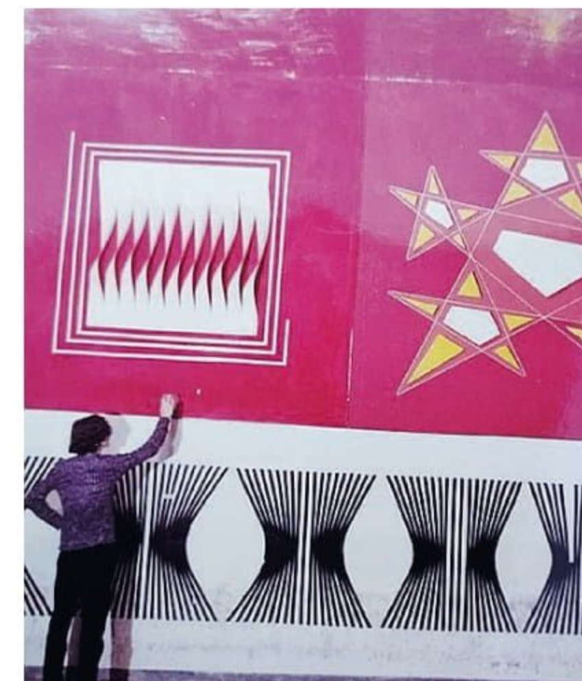
«ABITARE» In alto, La Martella nella foto di Ludovico Quaroni. E il «Piper»